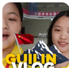
Langkah Kosayu ke China