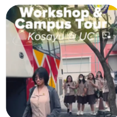
Campus Tour, Eksplorasi Jurusan