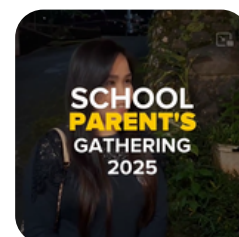
Orangtua dan Kosayu Bersinergi