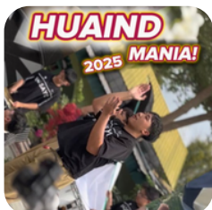
HUAIND Mania 2025