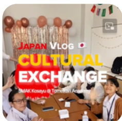
Kosayu menembus Jepang