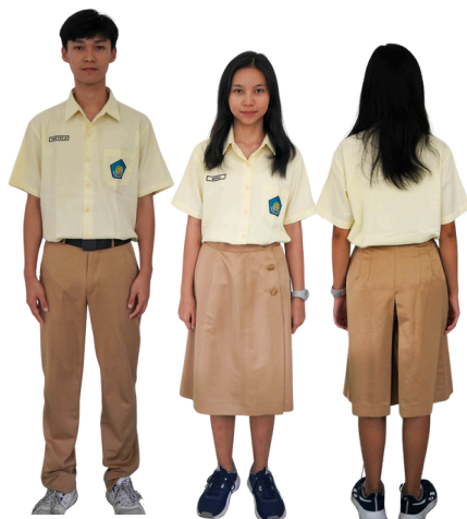
Seragam SMAK Kolese Santo Yusup