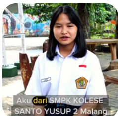
Kae memilih sekolah TERBAIK 🥰👍