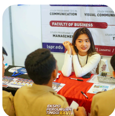
Ekspo Perguruan Tinggi