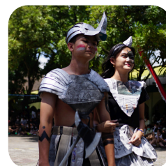
Perayaan HUT RI