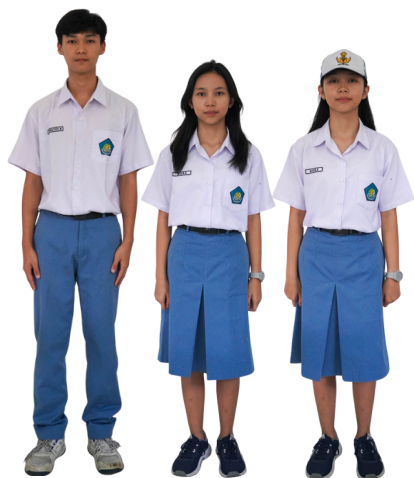
Seragam Nasional Putih Abu-Abu